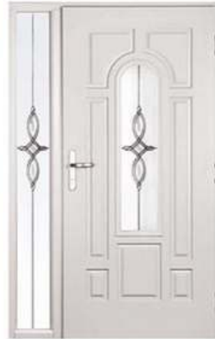
PRESIDENT 2 Цвет: белый