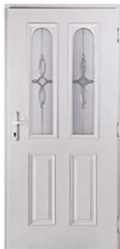
CONSUL 6 Цвет: белый