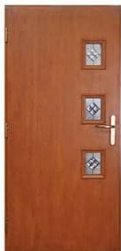
ATTACHE 5 Цвет: винчестер