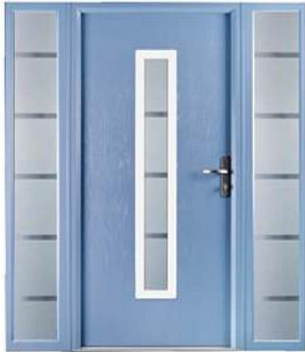
DIPLOMAT 46 RAL: 5012