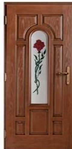
PRESIDENT 2 Цвет: орех