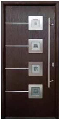
DIPLOMAT 40 Цвет: красное дерево