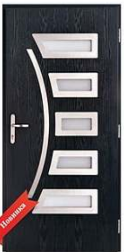
DIPLOMAT 26 RAL 5008