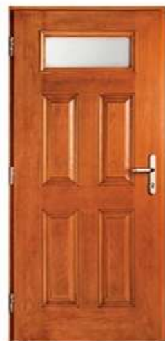
CONSUL 8 Цвет: золотой дуб