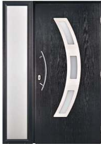
DIPLOMAT 22 RAL 7016