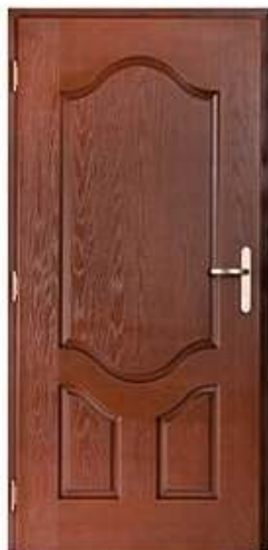
AMBASSADOR 1 Цвет: орех