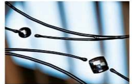
Kristal Swarovski - Новинка!