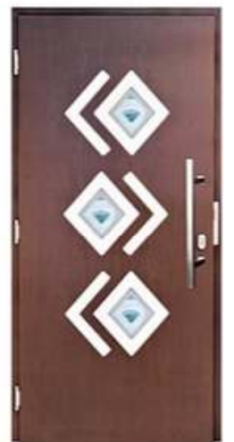
DIPLOMAT 80 Цвет: красное дерево

Представленные выше двери – это только несколько вариантов из многочисленных решений, которые могли бы быть.