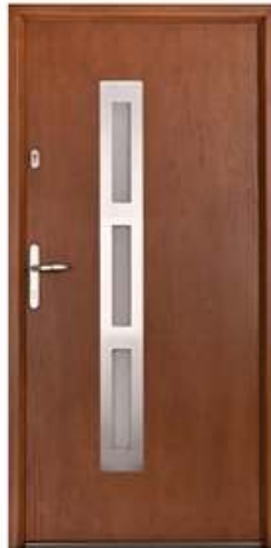
DIPLOMAT 42 Цвет: орех