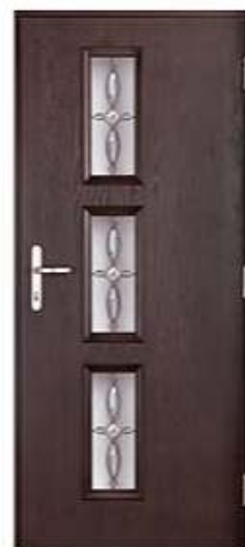
ATTACHE 14 Цвет: болотный дуб

Вы сами решаете, какой будет окончательный вид вашей композитные двери.