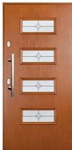
ATTACHE 10 Цвет: винчестер