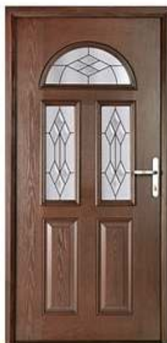
CONSUL 3 Цвет: красное дерево

Вы сами решаете, какой будет окончательный вид вашей композитные двери.