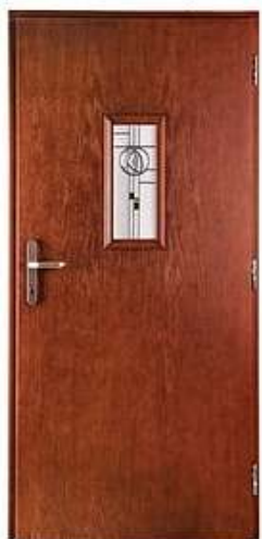
ATTACHE 2 Цвет: орех