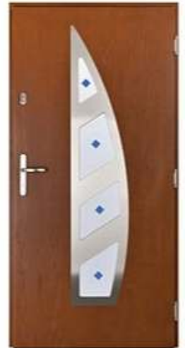
DIPLOMAT 73 Цвет: орех