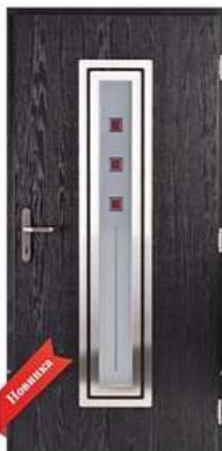
DIPLOMAT 4S RAL 7016