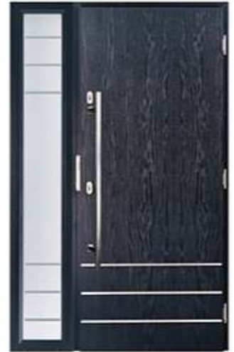
DIPLOMAT 0E RAL: 5008