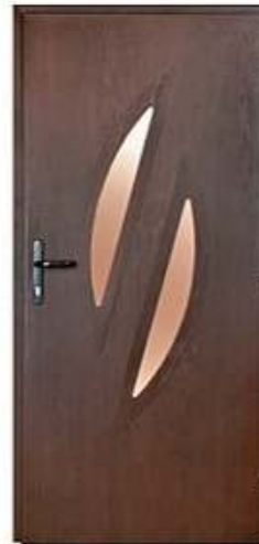
DIPLOMAT 64 Цвет: темный дуб