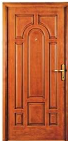
PRESIDENT 1 Цвет: золотой дуб