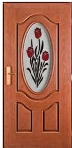
AMBASSADOR 2 Цвет: золотой дуб