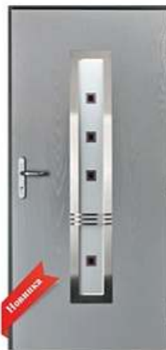
DIPLOMAT 46 + декоративная рамка RAL: 7040